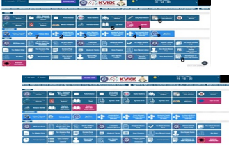
Şekil 3.1-1. Ege Bilim Platformu (No:9) (Üst Resim 2019, Alt Resim 2020-Güncellenmiş)

Bkz. Kanıt C.3.2-6. Ege Bilim Platformu Ekran Görüntüsü